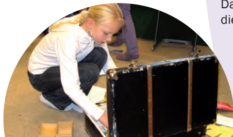
Mit dem Adventskoffer in der Carl-Orff-Schule und Lernort Bargteheider Kirche.

So ist der Koffer auch zum Grundmotiv unseres Logos geworden. Immer wenn es um religionspädagogische Angebote geht, sind wir „Mit Gott unterwegs“ und motivieren die Kinder, einen Teil dieses Weges mit uns zusammen zu gehen. Gemeinsam können wir viele Schätze unserer langen christlichen Tradition in Geschichten, Bildern und Symbolen entdecken.